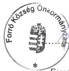
Rakaczki Zoltán Rakaczki Zoltán polgármester Forró Község Önkormányzata